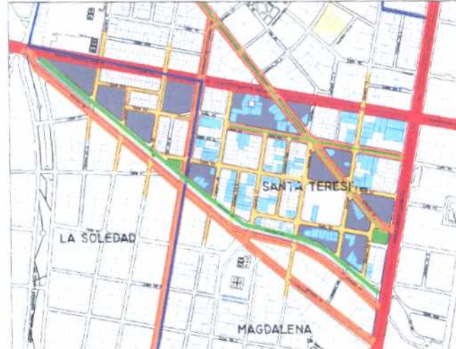
Inmuebles de Interés Cultural - MORFOLOGÍA EN PLANTA