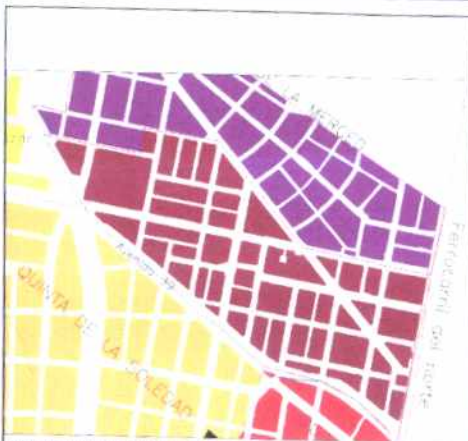
PLANO DE URBANIZACIONES

El barrio limita al norte con la calle 45, al occidente termina en una punta, al sur con la avenida 39 y el río Arzobispo y al norte con la avenida Caracas. Sus vías limitrofes y dos más internas se presentan como avenidas, lo cual es curioso para un barrio de tan pequeñas proporciones.