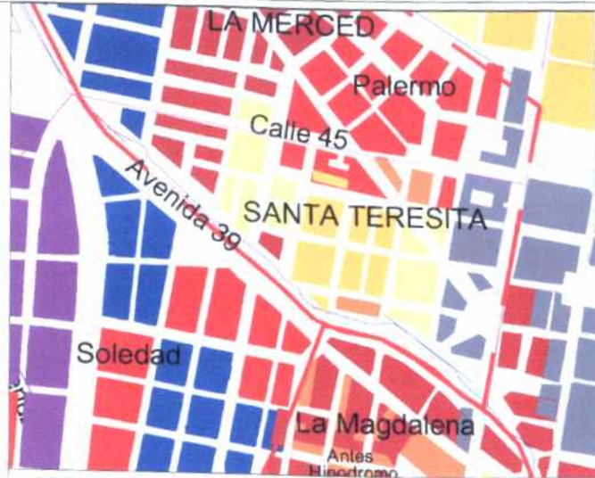
CRECIMIENTO HISTÓRICO - CRONOLOGÍA